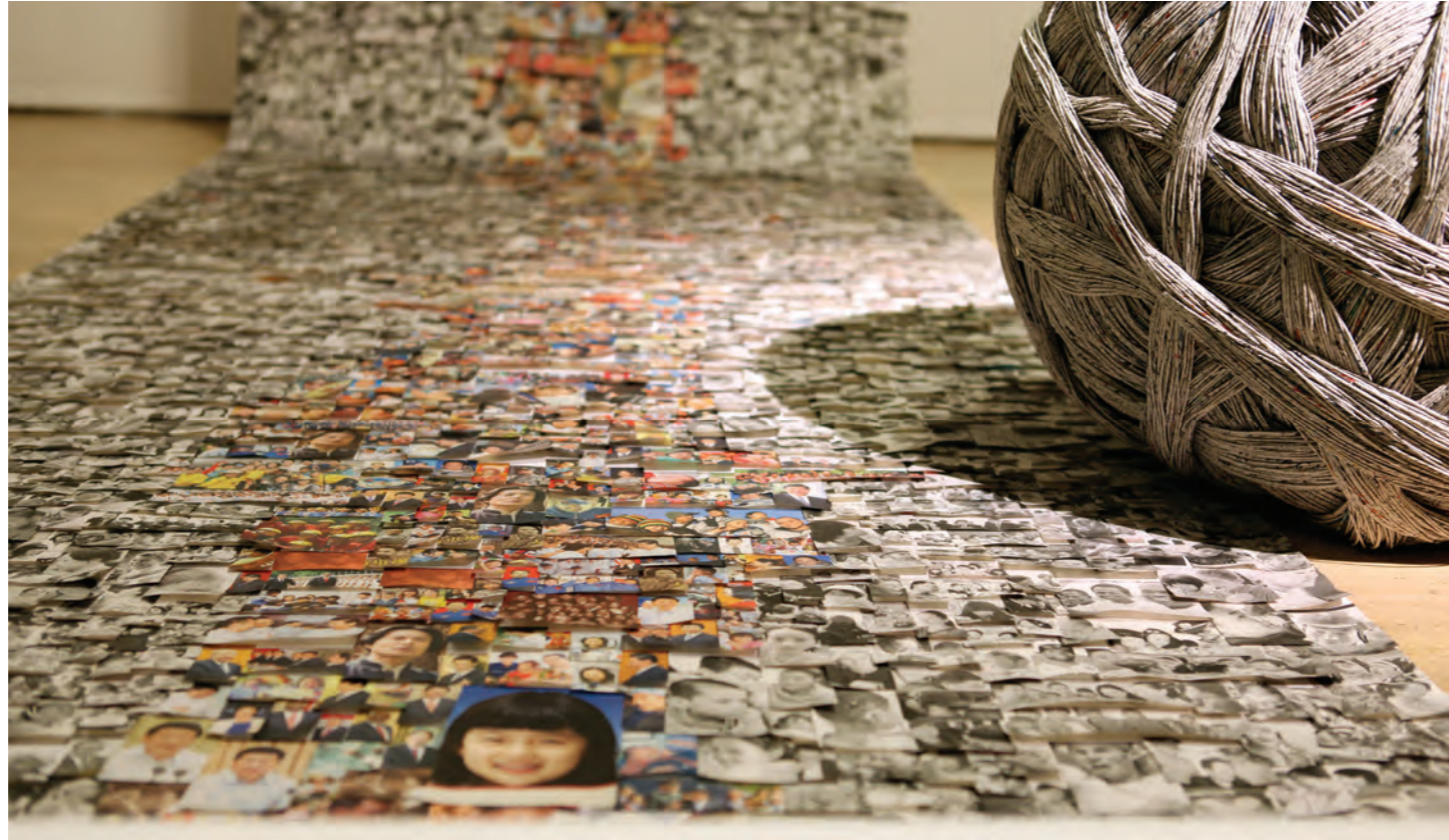
Detailbeeld uit tentoonstelling 'CODA Paper Art'