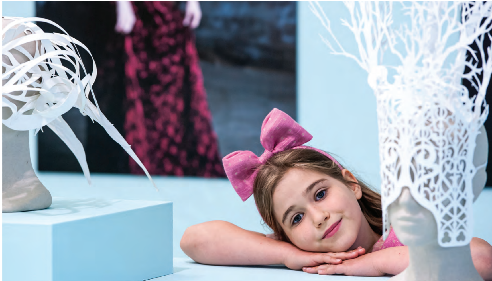
Tentoonstelling: 'CODA Paper Art'