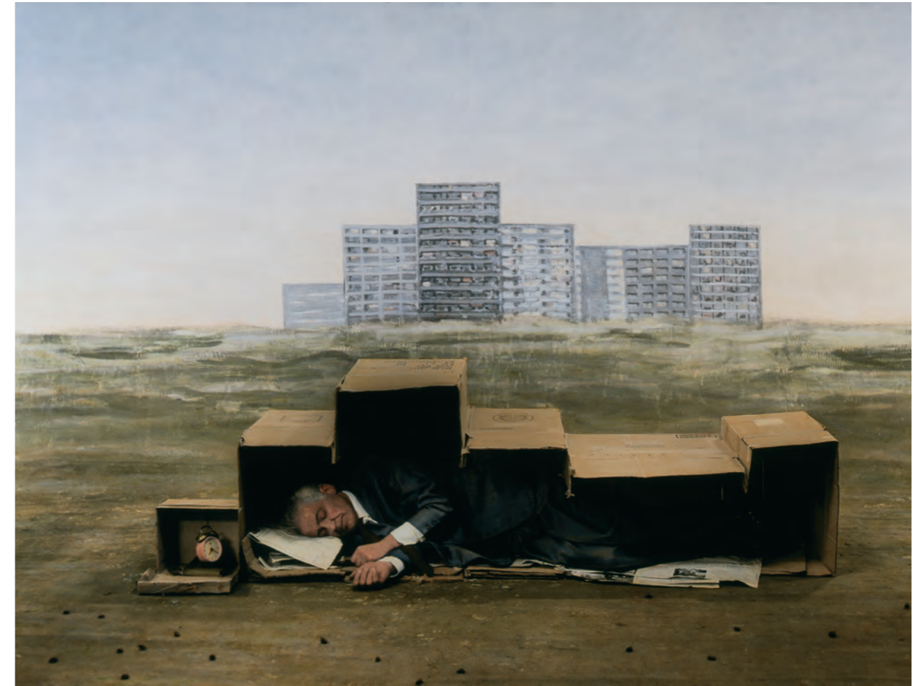
Tentoonstelling 'Teun Hocks'

Deze twee topstukken waren in verband met een verbouwing in het Rijksmuseum van Oudheden in Leiden tijdelijk terug in Apeldoorn – de gemeente waar ze in 1858 gevonden zijn. De halssieraden dateren uit circa 600 voor Christus en tonen het hoogwaardige vakmanschap in deze periode. Met deze presentatie heeft CODA Museum een duidelijke link gelegd tussen de bijzondere aandacht die zij schenkt aan sieraden enerzijds en aan de historische collectie met aandacht voor historie en archeologie van Apeldoorn en omgeving anderzijds.