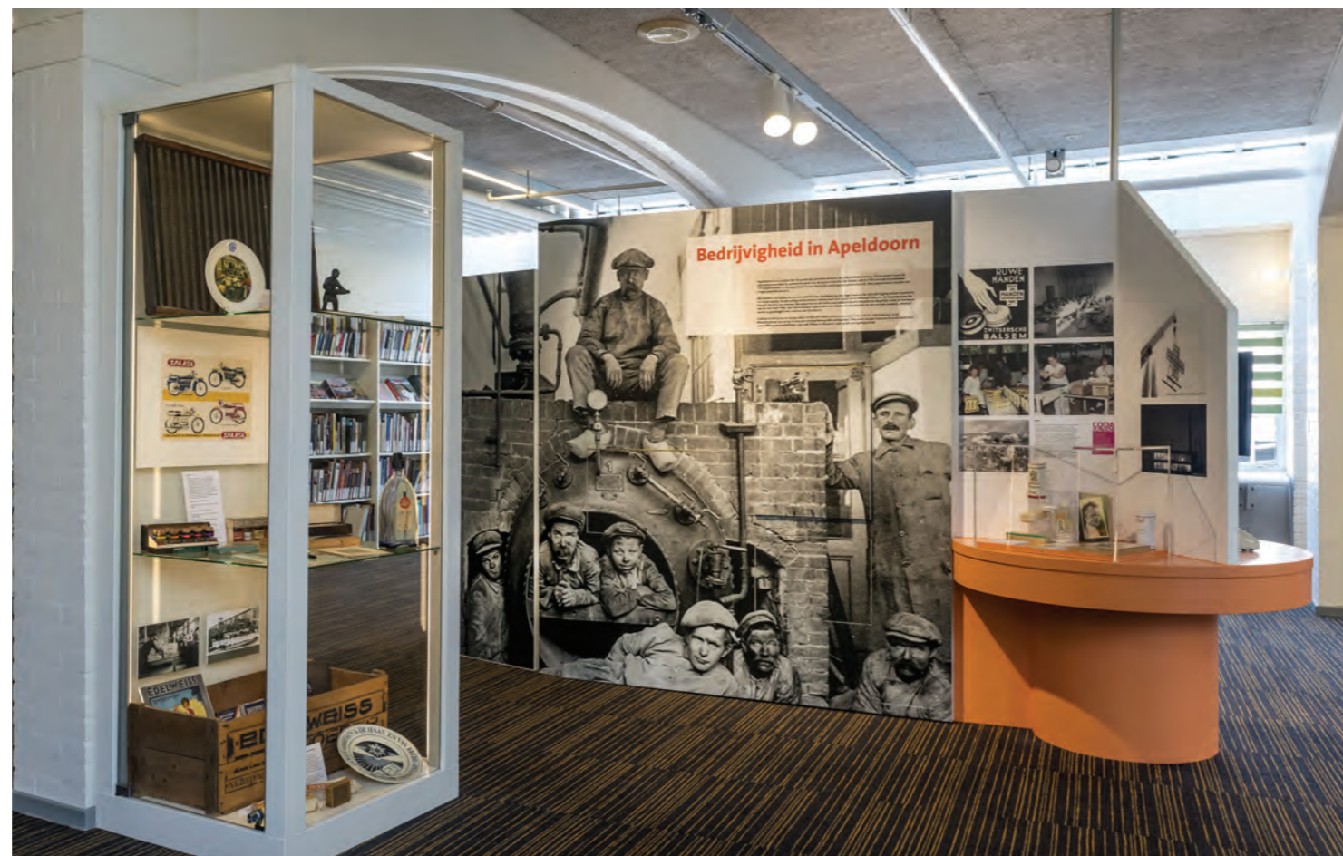
Eén van de historische paviljoens in CODA Centrale Bibliotheek