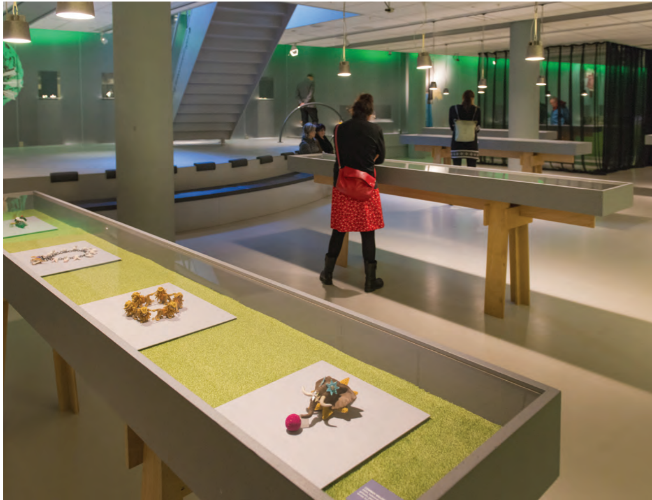
Tentoonstelling 'Into the Zoo'