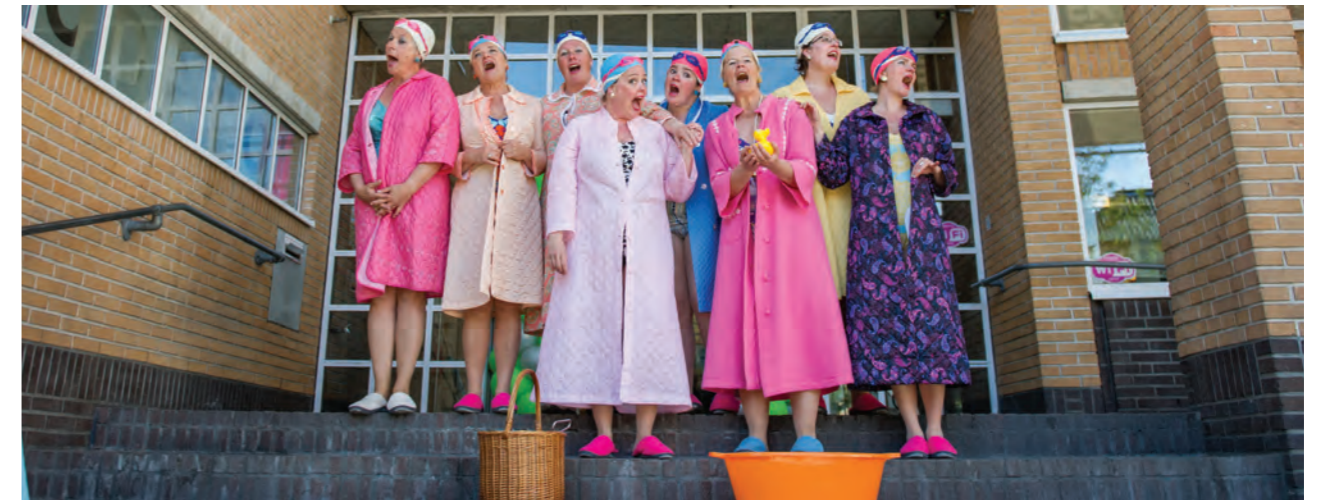
Ludiek welkom door De Zingende Badmutsen tijdens het Open Huis

Na de succesvolle herinrichting van CODA Junior zijn dit jaar de eerste en tweede verdieping van CODA Centrale Bibliotheek volgens hetzelfde unieke concept opnieuw ingericht. Ook hier werden de drie functionaliteiten bibliotheek, museum en archief op één plek samengebracht. Met meer ruimte voor lezen, studeren en ontmoeten waarbij de bibliotheekcollectie door de vernieuwde presentatie beter tot haar recht komt. De vijf historische paviljoens besteden aandacht aan de geschiedenis van Apeldoorn en omgeving waarbij elk paviljoen een specifiek thema heeft. Het zesde paviljoen staat in het teken van Europa en biedt plaats aan het Europe Direct Information Centre. De heropening werd zondag 19 april samen met vele bezoekers op feestelijke wijze gevierd. Er waren rondleidingen, mini-lezingen, theateracts en tal van kinderactiviteiten.