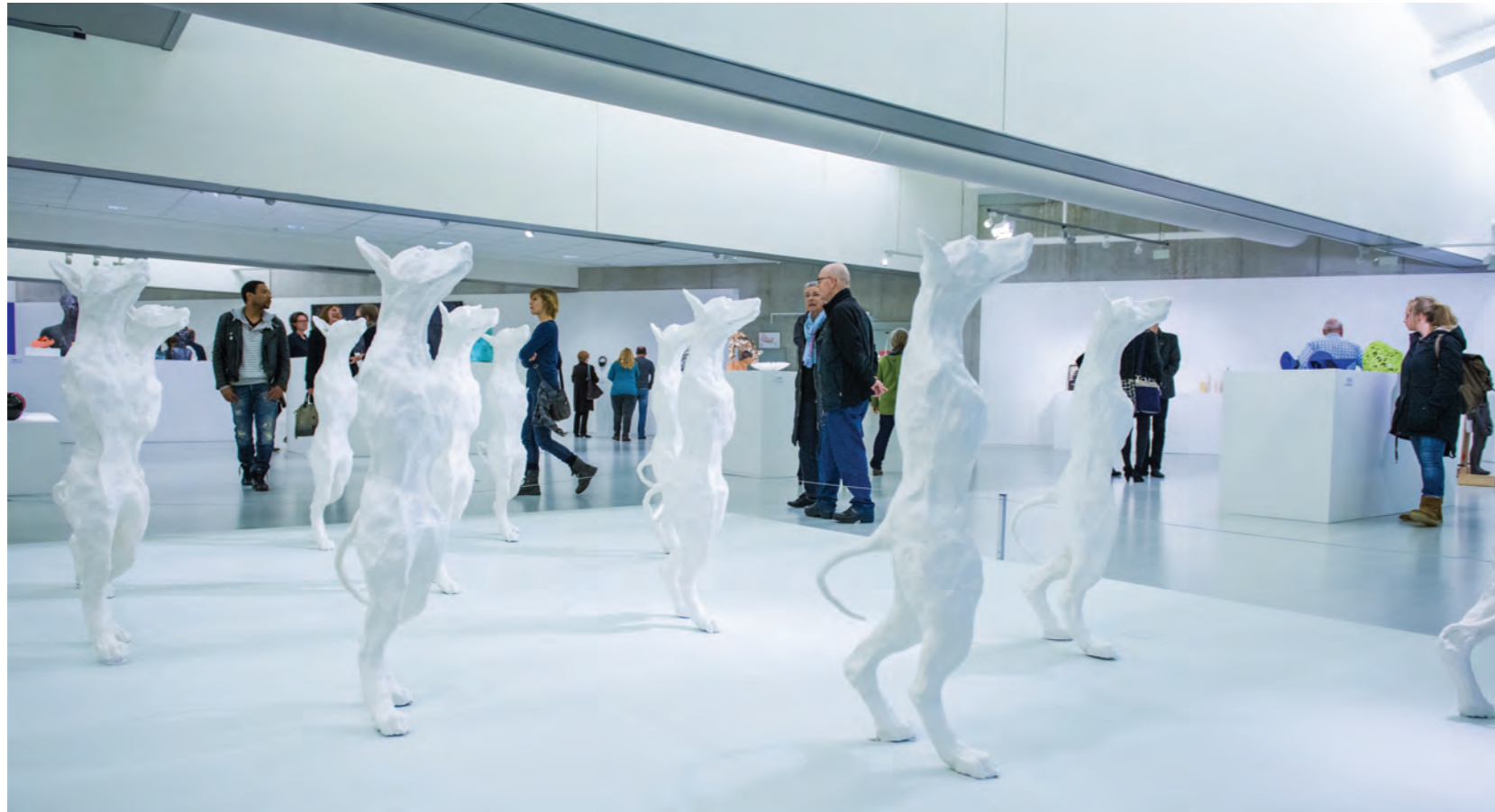
Tentoonstelling 'Keramiek Triënnale 2015'