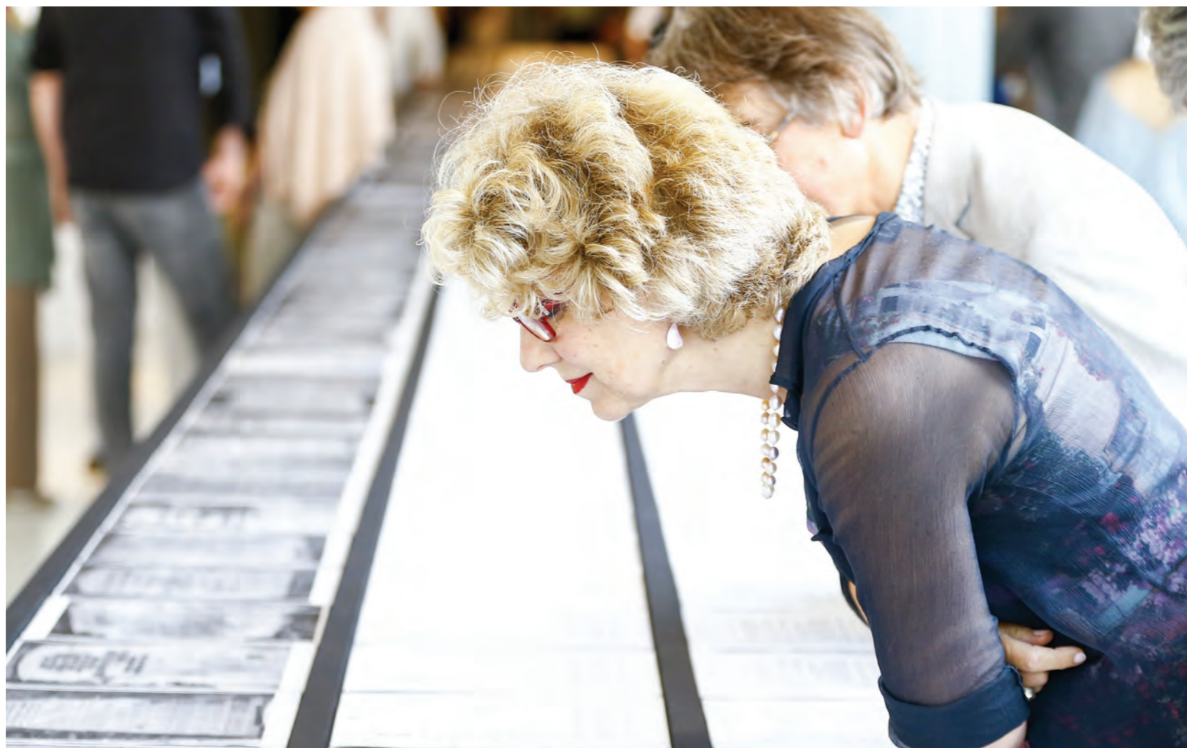
Tentoonstelling: 'Sluipweg - Hans van Houwelingen'

CODA Bibliotheek heeft deelgenomen aan de vierjaarlijkse audit voor de landelijke certificering en heeft de positieve waardering 'Erkenning' behaald. De audit werd in opdracht van de branchevereniging en de VNG verzorgd door de Stichting Certificering Openbare Bibliotheken (SCOB). Het doel was de kwaliteit van het netwerk van Openbare Bibliotheken te waarborgen en te bevorderen. CODA Bibliotheek werd in september bezocht en het programma bestond onder andere uit gesprekken met vertegenwoordigers van de verschillende stakeholders, de gemeente Apeldoorn, Ondernemingsraad CODA en met directie, management en medewerkers van CODA. Voorafgaand aan de audit heeft CODA een uitgebreide zelfevaluatie geschreven, opgesteld aan de hand van verschillende normen afgeleid van het INK-model. In de rapportage staat dat CODA Bibliotheek aan alle normen voldoet en op verschillende onderdelen hier zelfs uitstekend aan voldoet. Dit laatste geldt onder andere voor de normen leiderschap, medewerkers en dienstverlening. Van de aanbevelingen is het advies om meer in te zetten op de maatschappelijke effecten van de dienstverlening van CODA Bibliotheek in plaats van alleen op harde outputgegevens, het meest waardevol.