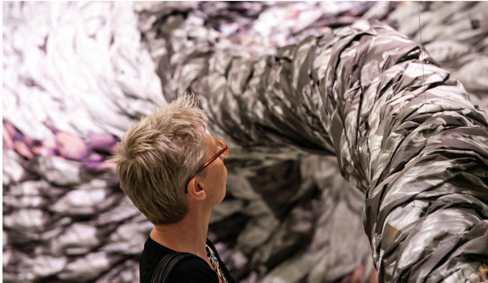
Tentoonstelling 'CODA Paper Art' | detailbeeld 'Tornado' van Erin Turner