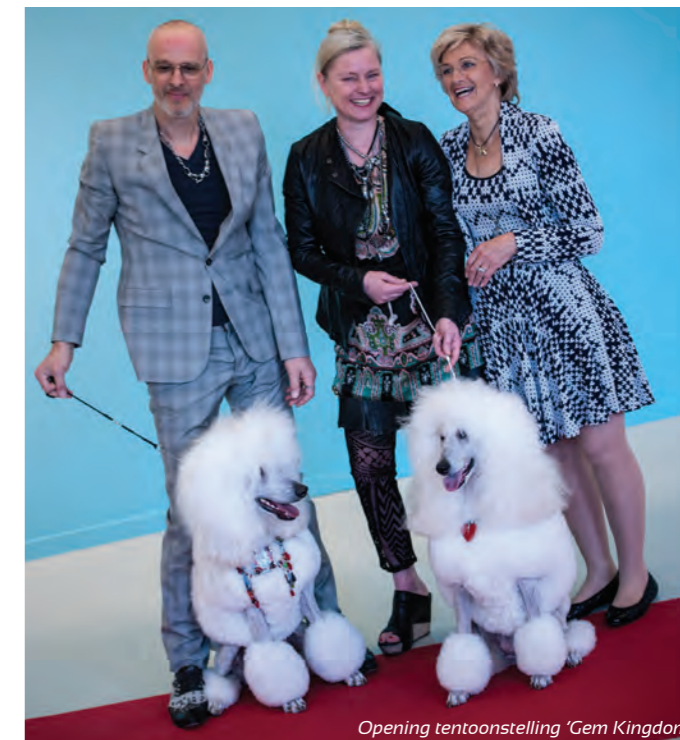
Opening tentoonstelling 'Gem Kingdom'

Papier is nauw verbonden met de geschiedenis van Apeldoorn en omgeving en dat was in deze tentoonstelling goed te zien. In het kader van het erfgoedfestival Gemaakt in Gelderland werd aan de hand van foto's, films en afbeeldingen een beeld van de ontwikkeling en geschiedenis van onze papierindustrie geschetst.