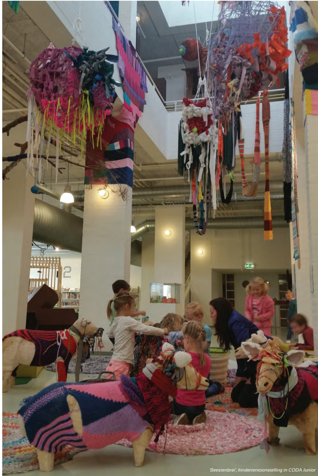
'Beestenbrei', kindertentoonstelling in CODA Junior