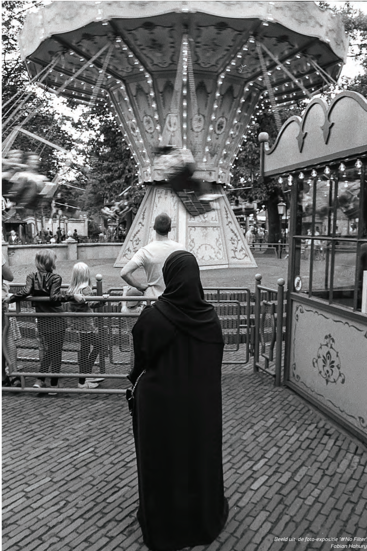
Beeld uit de foto-expositie '#No Filter' Fabian Hahury